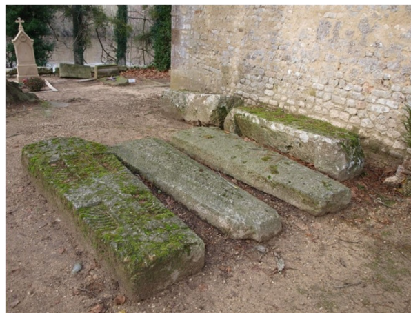
Sarcophages de Saint-Pierre-les-Eglises

Pour aller plus loin : visitez le musée archéologique et ne manquez pas l'église avec son chœur mérovingien et sa stèle chrétienne d'Aeternalis et de Servilla.